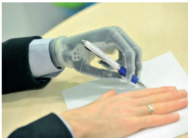
» Bionske proteze so vedno bolj izpopolnjene in vedno bolj učinkovito krmiljene

V prihodnjih desetletjih se bo dogajala radikalna nadgradnja fizičnega in duševnega sistema našega telesa, ki je že sicer danes v polnem razvojnem teku in bo uporabljala tehnologije prihodnosti tudi zamenjavo naših vitalnih organov in integracijo mnogoštevilnih implantabilnih vsadkov naslednje generacije. Sliši se kot znanstvena fantastika, vendar to ni, je le razvojno dogajanje v okviru projekta »Human body 2.0«. Danes že vemo, kako preprečiti večino degenerativnih bolezni s prehrano in prehranskimi dodatki, to pa bo most za nastajajočo biotehnološko revolucijo, ki bo nato postala naprej, most za nanotehnološko. Do leta 2030 bo zaključeno obratno inženirstvo človeških možganov in nebiološka inteligenca se bo združila z našimi biološkimi možgani. Nekaj zanimivih tehnoloških smernic smo že v preteklosti obravnavali tudi na naših nanotehnoloških dnevih. Kot vemo, imajo različne proteze že dolgo zgodovino, pred več sto leti so se izdelovale iz lesa, usnja in drugih materialov. Njihov znanstveni napredek so v 20. stoletju poganjale uničujoče vojne. Danes se na primer rutinsko zamenjujejo kolčni in kolenski sklepi in celotne proteze so zasnovane iz novih materialov, povezane z umetno inteligenco, ki posnema funkcije delovanja naravnih mišic, vedno bolj je prisotna